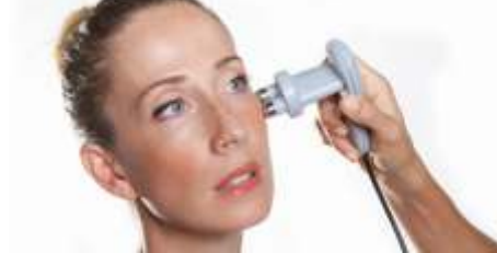
TECAR BIPOLARE AESTETIC