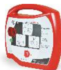
DEFIBRILLATORE SEMI AUTOMATICO