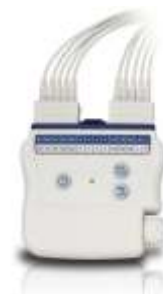
ECG WAM WIRELESS