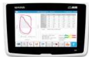
SPIROMETRO SPIROLAB NEW