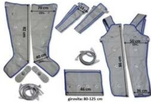
girovita: 80-125 cm