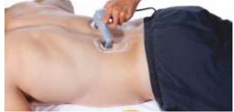
TECAR BIPOLARE PROFILE