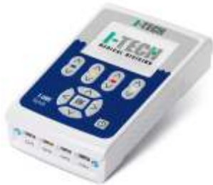
Elettro Polifunzionale 4 ch.