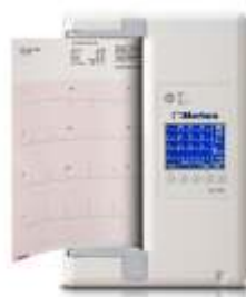
ECG MORTARA 12 CANALI