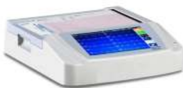
ECG 12 CANALI TOUCHSCREEN