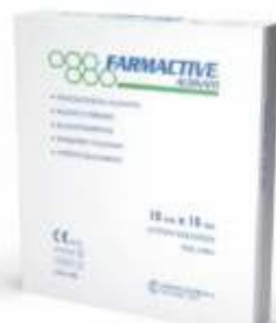
MEDICAZIONE ALGINATO DI CALCIO