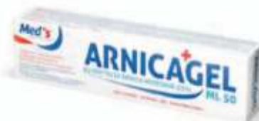
GEL FRESH ARNICA 30% 50ml