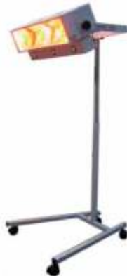
LAMPADA 3 IR