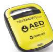
AED ADULTO + PEDIATRICO