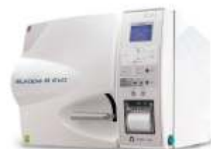
AUCLAVE EUROPA B