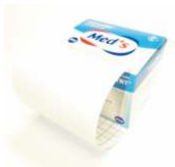
TNT ADESIVO PER FISSAGGIO MEDICAZIONE