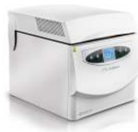
4 FUNZIONI IN 1 MULTISTERIL