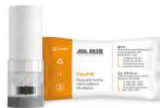
TURBINA MONOUSO FlowMIR