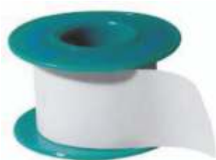
CEROTTO IN TNT