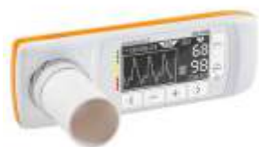
SPIROMETRO SPIROBANK II