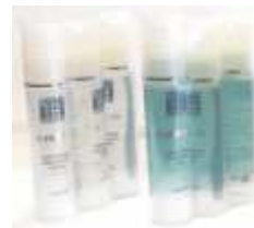
SIERO: JALURONICO COLLAGENE DNA VITAMINICO