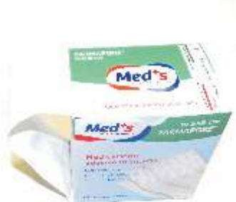
MEDICAZIONE ADESIVA IN STRISCIA