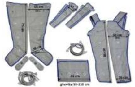
girovita: 55-110 cm