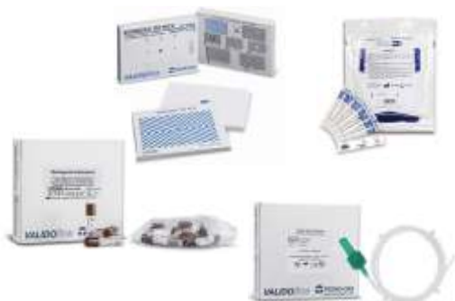
TEST DI STERILIZZAZIONE